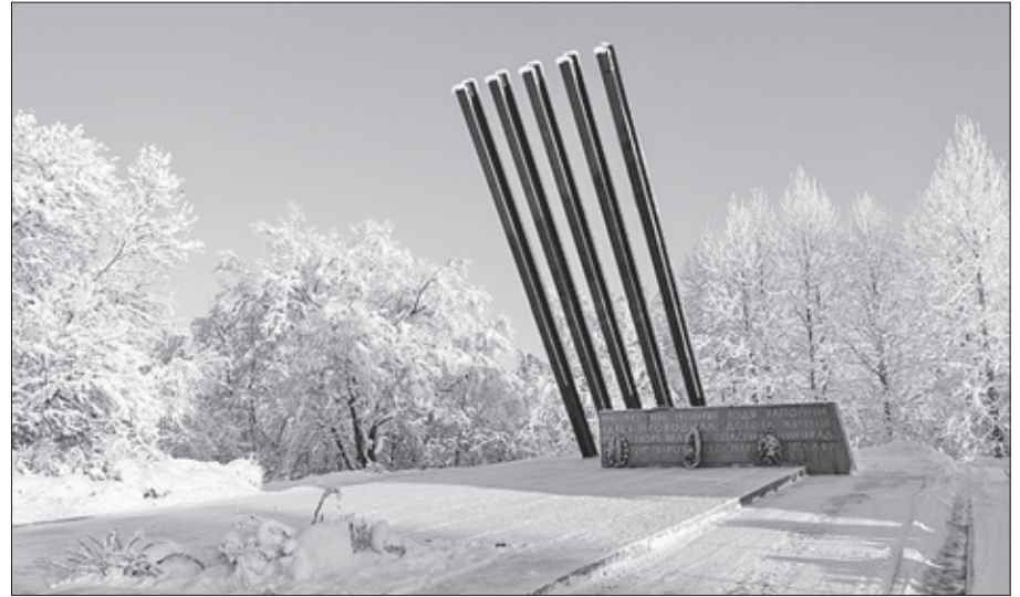
Мемориал «Катюша» в Углово, входящий в «Зелёный пояс Славы»