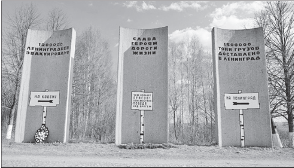
Мемориальный участок Дороги жизни в Романовском поселении